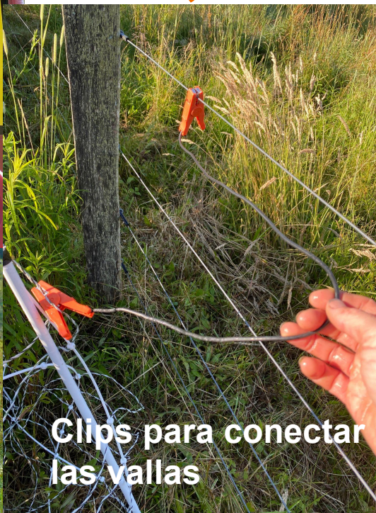
Clips para conectar las vallas