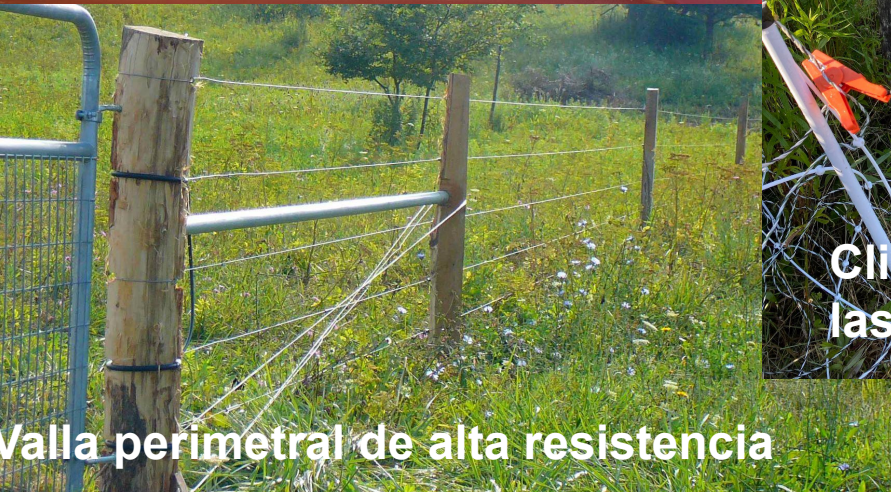
Valla perimetral de alta resistencia