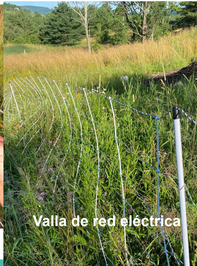
Valla de red eléctrica